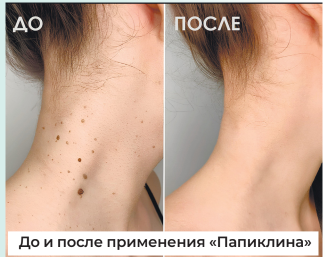
До и после применения «Папиклина»

- Совершенно верно! Сироп «Папиклин» может помочь не просто избавиться от папиллом, но и улучшить общее самочувствие, благодаря очищению организма от паразитов. В таком случае может появиться больше энергии, у человека будет возможность выглядеть мо-