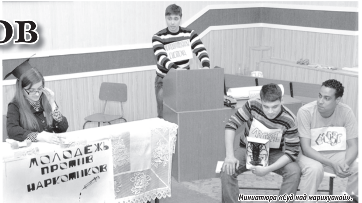
Миниатюра «Суд над марихуаной».