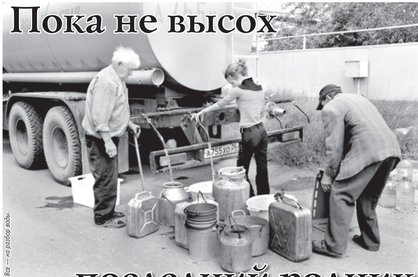
Все — на разбор воды.