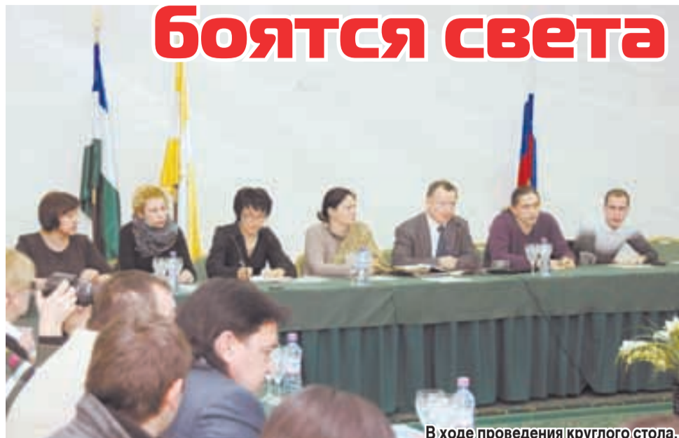
В ходе проведения круглого стола.

На Ставрополье разразился громкий скандал, связанный с проявлением садизма и немотивированной жестокости со стороны представителей правоохранительных органов.