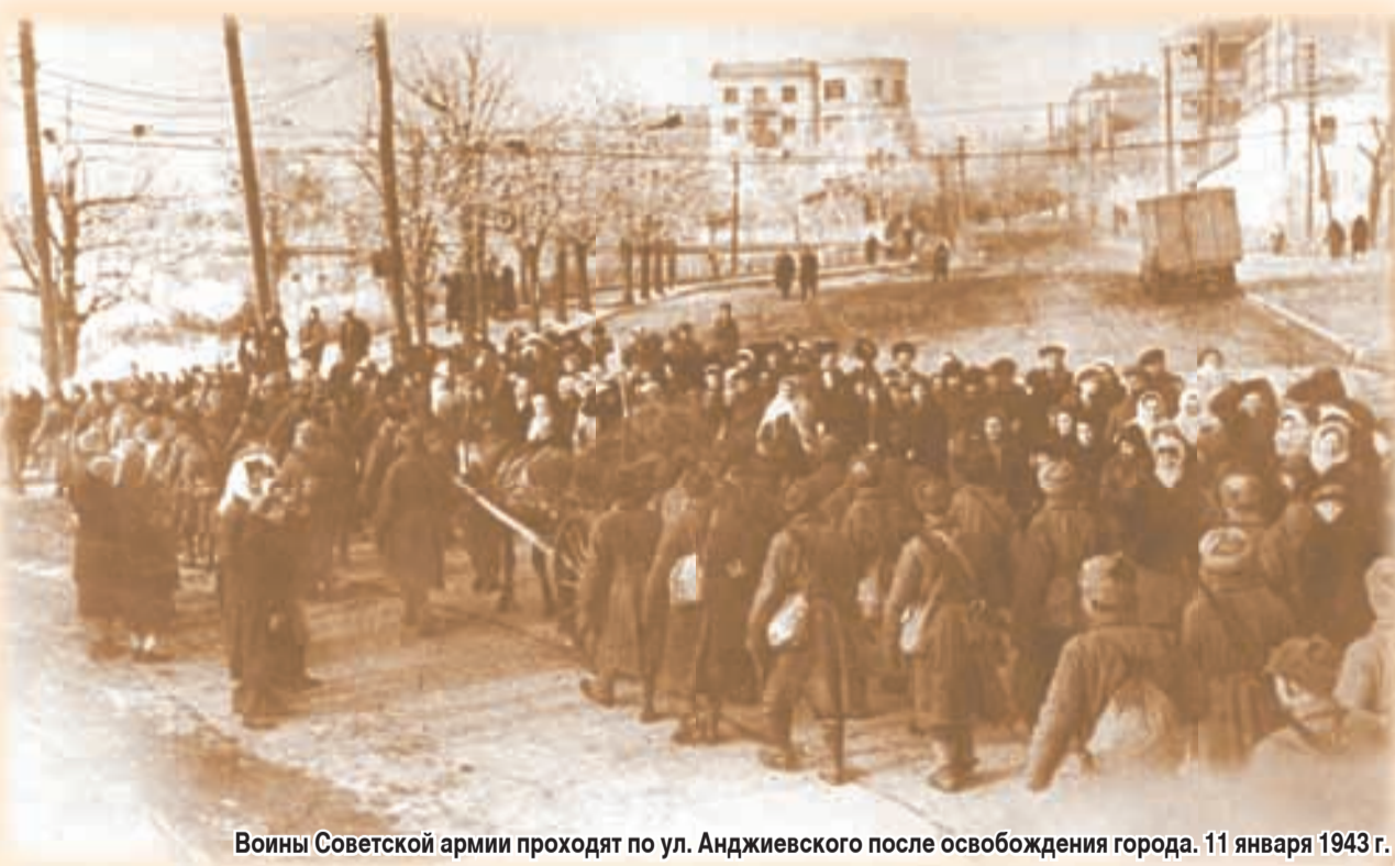
Воины Советской армии проходят по ул. Анджиевского после освобождения города. 11 января 1943 г.

СТАРАЯ тетрадь заканчивается. Заканчивается простыми и емкими словами, с которыми мы не можем не согласиться: