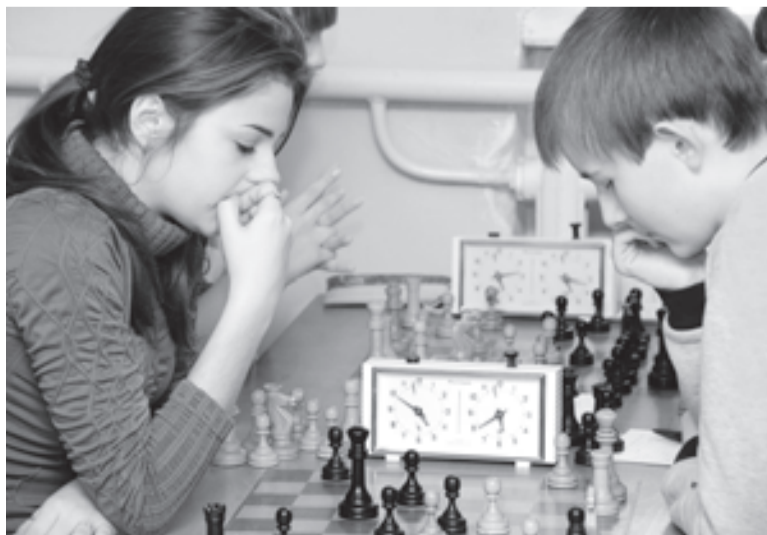
Полосу подготовила Татьяна ПАВЛОВА.