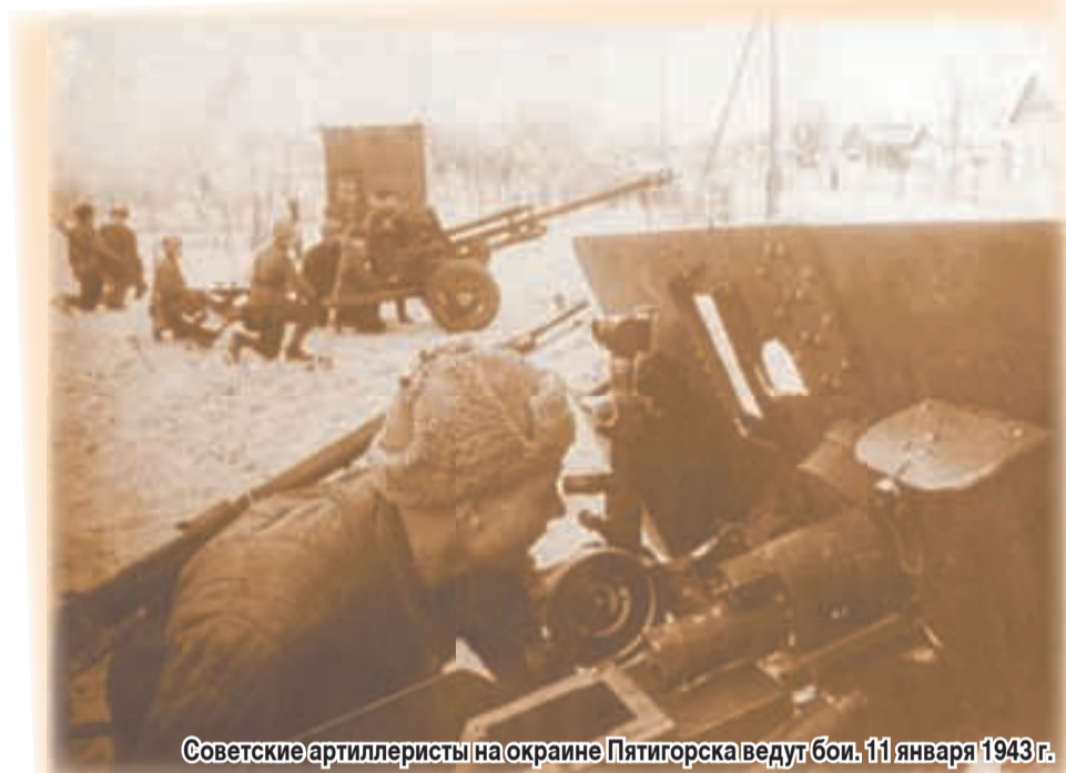
Советские артиллеристы на окраине Пятигорска ведут бои. 11 января 1943 г.

В фондах Пятигорского краеведческого музея хранятся письма с фронта родным и друзьям, письма на фронт, а также дневниковые записи, воспоминания участников Великой Отечественной войны. Это и те, кто сражался на передовой, и те, кто лечил раненых, и кто, будучи совсем юным, стоял у станка.