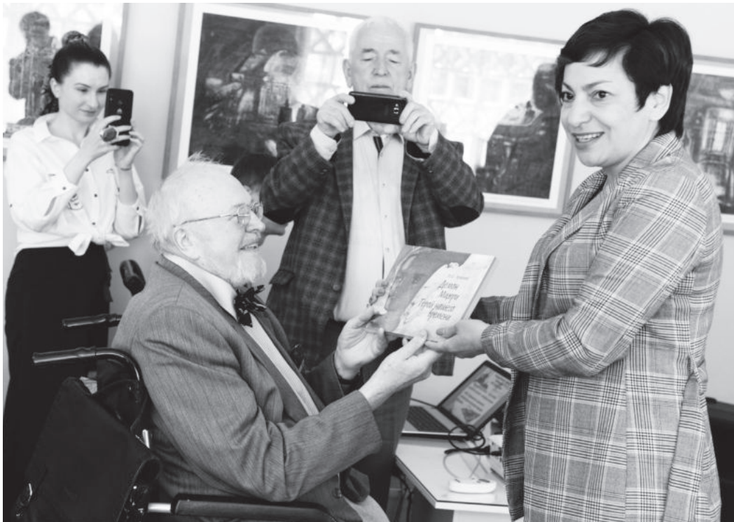
Автор > НАТАЛЬЯ ТАРАСОВА